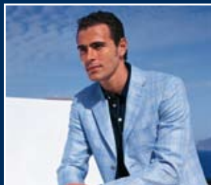
Images taken from the Anteprema Album S/S 07 Tailoring fabrics collection by Ermenegildo Zegna